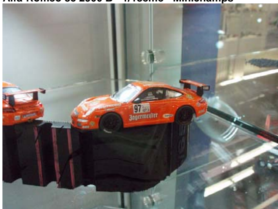
Porsche 911 Jägermeister - 1/43ème - Minichamps