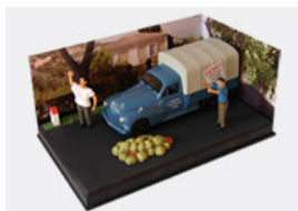
26. La manifestation