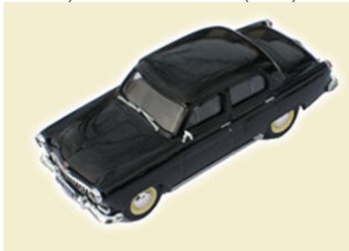
6) GAZ VOLGA M21