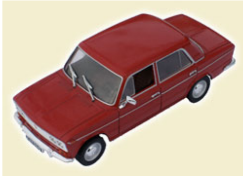
4) ŁADA 1500 (1974) VAZ 2103