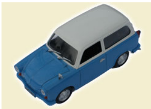
8) TRABANT P50 KOMBI