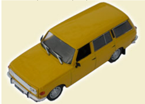
5) WARTBURG 353 TOURIST (KOMBI)