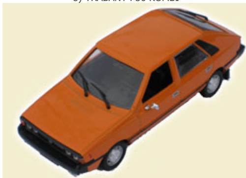
9) FSO POLONEZ