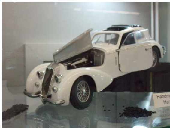
Alfa-Romeo 8c 2900 B - 1/18ème - Minichamps

http://www.foxtoys.cz/image/Vystavy/nrb09/norimberk09/Data/thumbs.htm