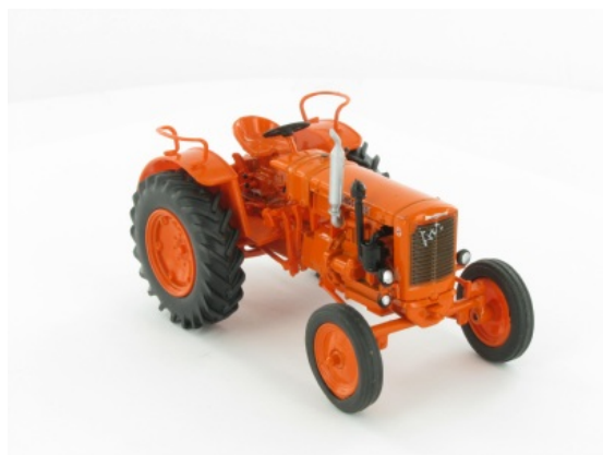
Vendeuvre Super DD