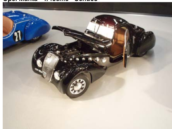
Peugeot 402 Darl'mat - 1/18ème - Norev