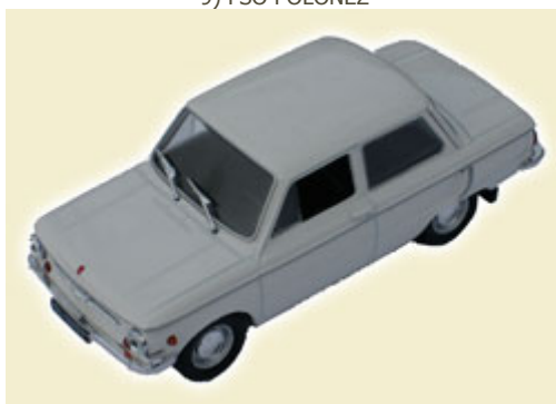
10) ZAPOROŽEC ZAZ 968