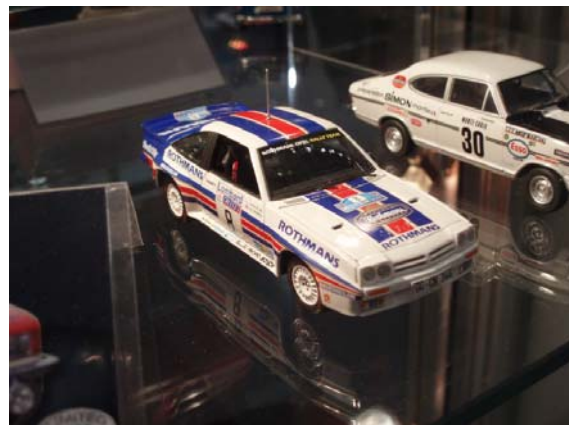
Opel Manta - 1/43ème - Schuco