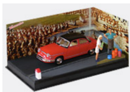
28. Les poteries d'Accollay