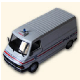
100. CITROËN C35 POLICE