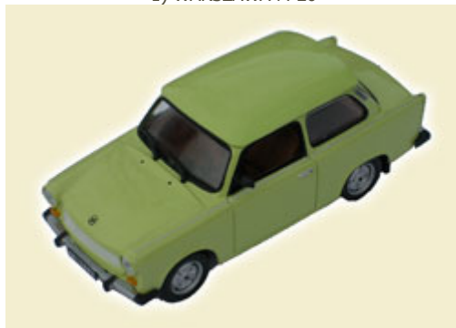
2) TRABANT 601 LIMOUSINE