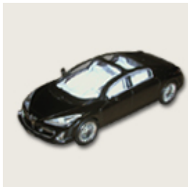
33. Peugeot 908 RC