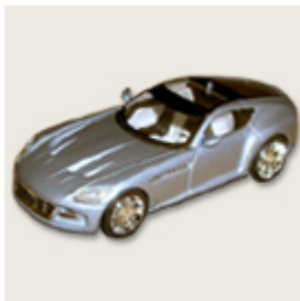
32. Chrysler Firepower