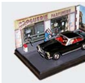
13. Le grand départ