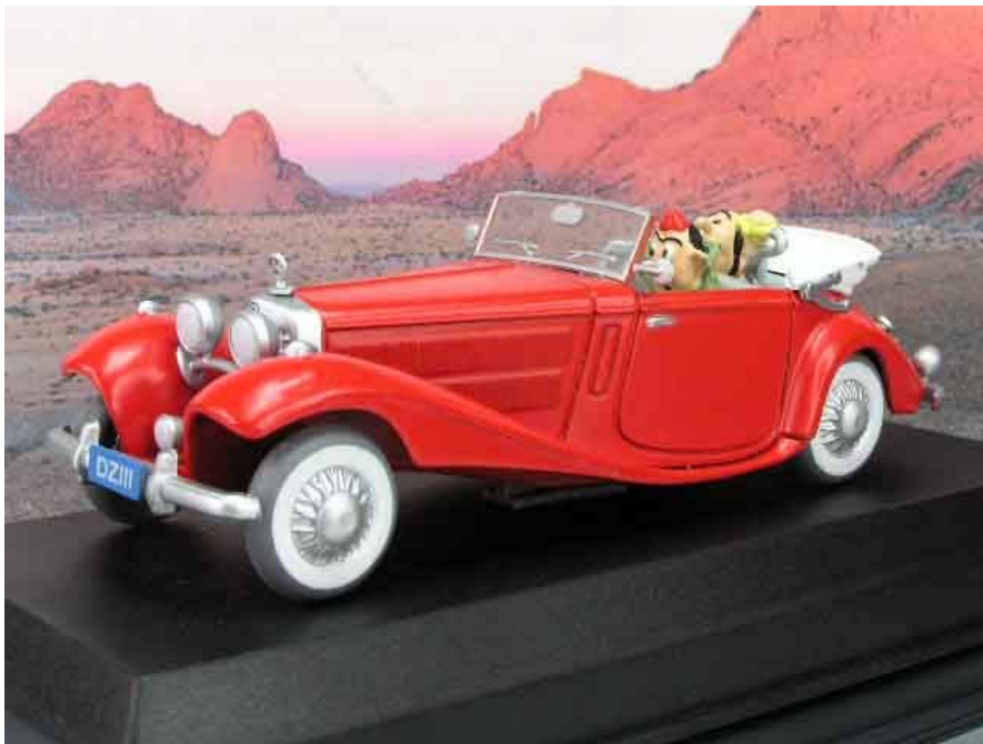
Mercedes 540 K