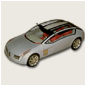
34. Renault Talisman