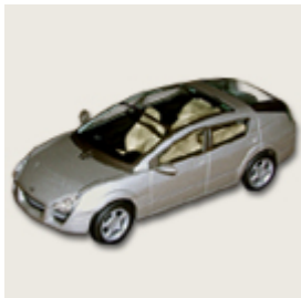
35. Webasto Welcome