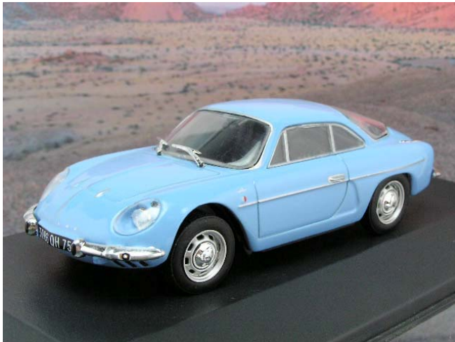
A110 1100 1963